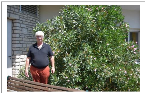
L'équipe ETD du Centre Hospitalier de ROYAN

Fiche d'information sur le Programme d'Education Thérapeutique multi-professionnelle en groupe et individuelle des patients adultes diabétiques.